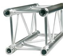
SZ 290 FC