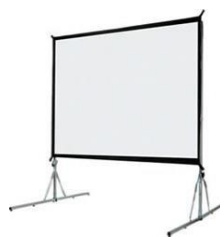
Ecran sur cadre