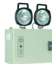
BAES Phares 2000 I.