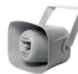
MSH 30 T