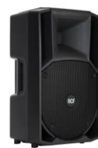
ART 712 A