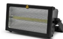
Atomic 3000 LED