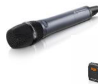
SKM 300-845 / SK300