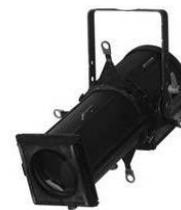
Découpe DW 105