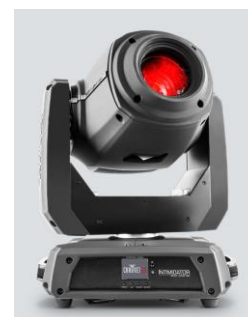
Intimidator Spot 375Z IRC